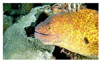
Moray eels come in many sizes and colours.