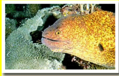
Moray eels come in many sizes and colours.